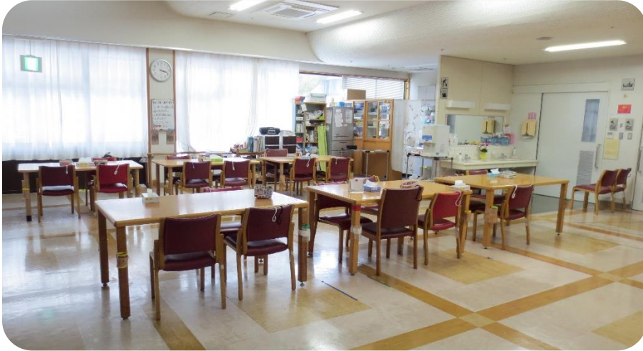
デイサービス食堂ホール