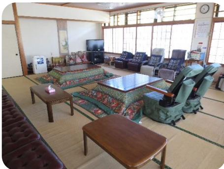
静 養 室